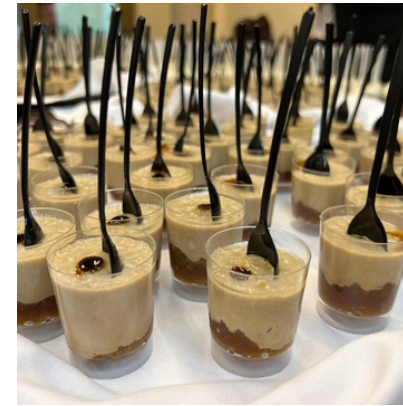
Vasito de mousse de foie de pato con cebolla caramelizada y reducción de módena