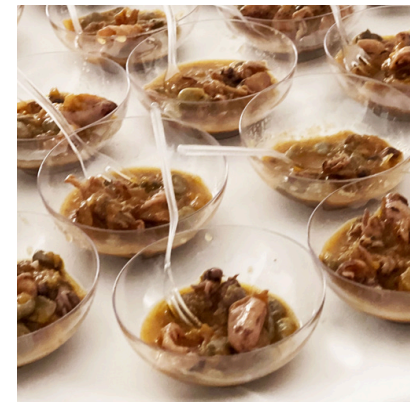
Chopitos salteados con habitas baby