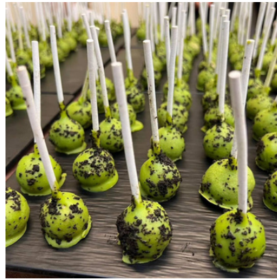
Cake pop invertido de salmón ahumado con guacamole