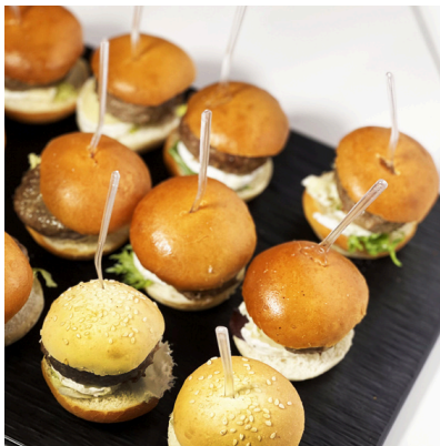
Ensalada de mix de hojas silvestres con jamón de pato, frutos secos y vinagreta