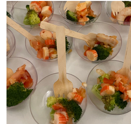
Cucharita de brócoli al vapor con vinagreta de gamba