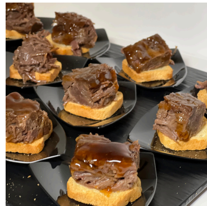
Cordero confitado con miel de romero y hierbas aromáticas