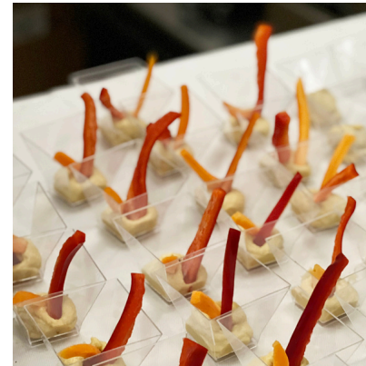
Hummus con crudités