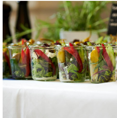
Ensalada de mix de hojas silvestres con jamón de pato, frutos secos y vinagreta